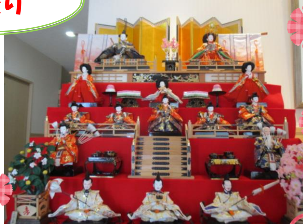
入居者様と飾ったお雛様